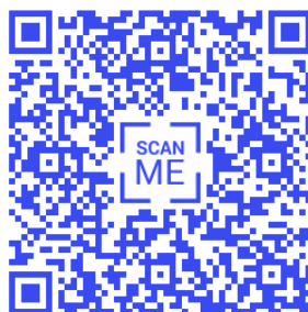
Figura 5 – QR Code personalizado

Algumas plataformas oferecem maior liberdade e criatividade, oferecendo inúmeras possibilidades de personalização: cores, estilos e até a inserção de logotipos de empresas ou marcas no centro dos códigos (Figura 5).