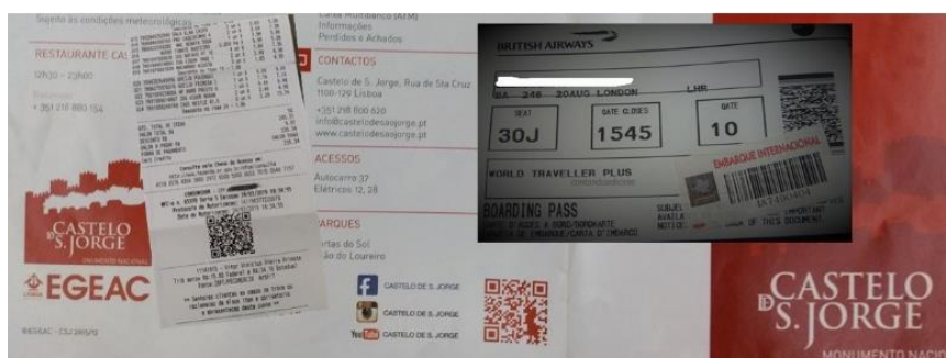
Figura 4 – QR Code em diversos setores