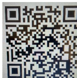
Figura 3 – Código de QR Code