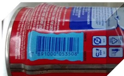
Figura 2 – Código de barras lineares

O QR Code (Figura 3) é um código de barras bidimensional, criado em 1994 pela empresa japonesa Denso Wave, pertencente ao grupo Toyota fabricante mundial de equipamentos automotivos. Seu objetivo era rastrear o estoque das peças fabricadas e para isso o código permitia decodificar seu conteúdo em alta velocidade por um equipamento de leitura. Na tradução para o português Quick Response significa “Resposta Rápida”.